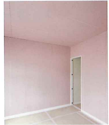
ハイクリンボードの施工事例（仕上げ材施工前）